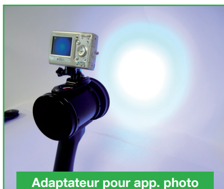
Adaptateur pour app. photo (31SUPVID365)

Ultra plate et légère, pour davantage d'autonomie, jusqu'à 8h en fonctionnement continu.