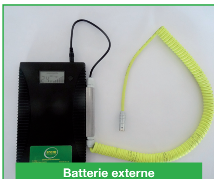
Batterie externe (31PBATEX365)

Robuste et légère, permet le rangement et le transport de l'équipement en toute sécurité.