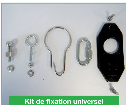
Kit de fixation universel (31KITAC365)

Permet de maintenir le projecteur en poste de travail fixe avec accrochage et décrochage rapides.