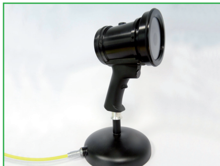
Socle pour recharge (31STACH365)

Ceinture réglable discrète et légère pour encore plus de confort, permet d'accrocher fermement le modèle sur batterie sans risque de chute grâce au système de sécurité tout en laissant une totale liberté de mouvement à l'inspecteur.