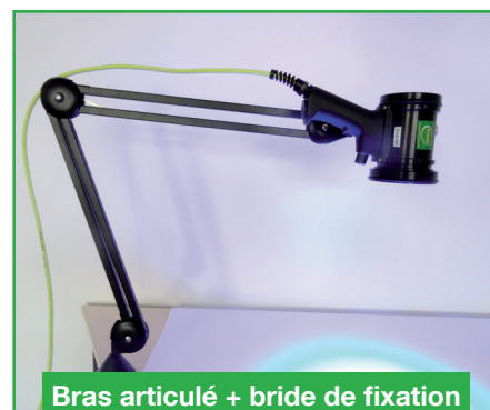
Bras articulé + bride de fixation (31BRAART365)

Permet de fixer un appareil photo sur le dessus de la coque de l'appareil lors d'expertises nécessitant une documentation.