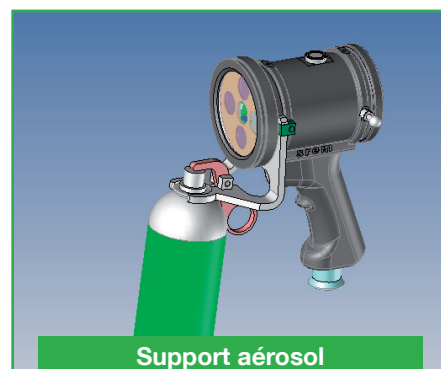
Support aérosol (31SUPAER365)

Projecteur en version spot sans poignée avec bras articulé pour poste fixe (performances identiques aux projecteurs S-LED, fonctionnement non temporisé).