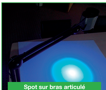
Spot sur bras articulé (prochainement)

Vous ne savez pas où poser votre projecteur ? Nous avons la solution pour le suspendre et le fixer afin qu'il reste à portée de main.