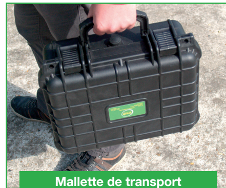
Mallette de transport (31VALED365)

Permet de poser et de charger la batterie interne en connectant simplement le projecteur à la borne de l'embase branchée sur le secteur (temps de rechargement complet « à vide » : 4h).